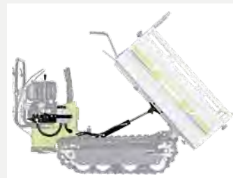
Kit ribaltamento idraulico per cassone.