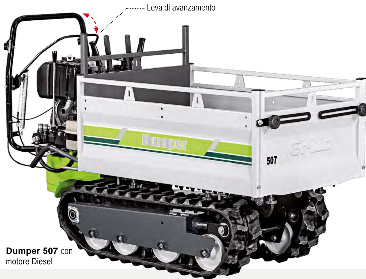
Dumper 507 con motore Diesel

I comandi a leva del Dumper 507 risultano sempre a portata di mano. I cingoli sono in gomma con maglie in acciaio. La macchina può essere equipaggiata con potenti motori a benzina da 270-301 cc e diesel da 349 cc , con avviamento autoavvolgente o elettrico, per garantire una portata utile fino a 500 kg nonché l'utilizzo di svariati accessori ed applicazioni. Entrambi i motori hanno come punto di forza principale la coppia a bassi regimi di giri. I motori del Dumper 507 sono di ultima generazione, moderni, a basse emissioni e consumi ridotti.